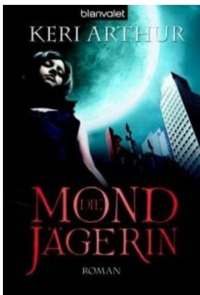
Copertina tedesca di Full Moon rising

Keri Arthur molto gentilmente ha accettato di rispondere a qualche domanda per il nostro blog, eccovi la breve intervista che le ho fatto: