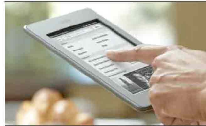
Ebook: come scegliere il reader giusto

Alle sue vittime dona l'opportunità di redimersi e cambiare,