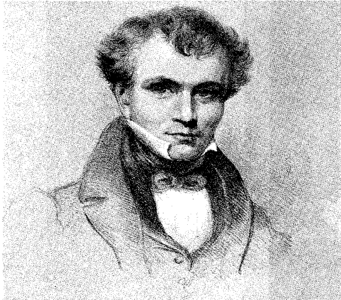
Il filosofo e il geologo: William Whewell (1794 – 1866)