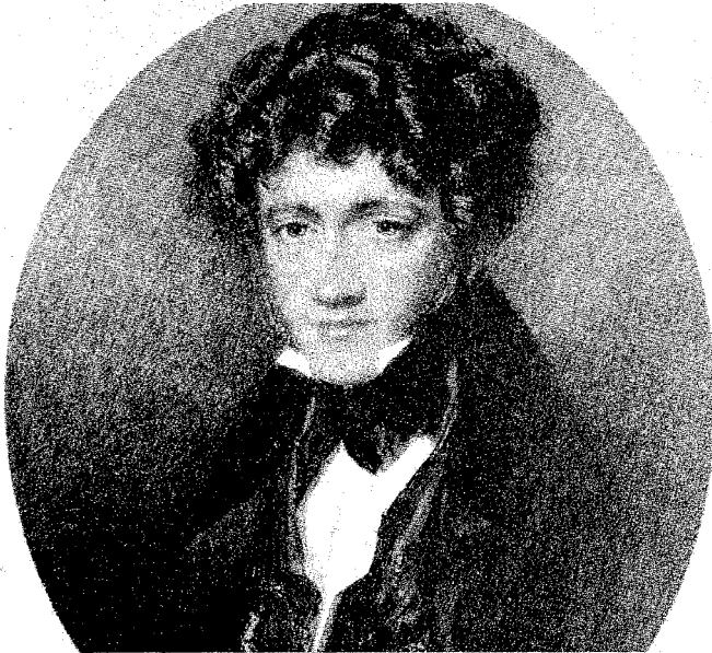
L'astronomo: William Herschel (1792 – 1871)