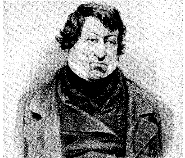
L'economista: Richard Jones (1790 – 1855)