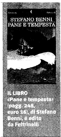
IL LIBRO «Pane e tempesta» (pagg. 248, euro 16), di Stefano Benni, è edito da Feltrinelli

Già, che ne sarà? Ai posteri l'ardua sentenza, eppure c'è della nobiltà in questa ostinazione, in questo brigare per rimanere se stessi. Meglio Benni degli scrittori che cambiano stile ad ogni volgere di stagione. Per rispetto del vecchio leone, riuscito anche stavolta a non tradire la sua voce, sorrideremo delle sue trovate. Faremo come quando la radio manda in onda, inopinatamente, un twist : piegheremo i gomiti ad angolo retto, fletteremo un poco le ginocchia ed accenneremo un passo di danza.