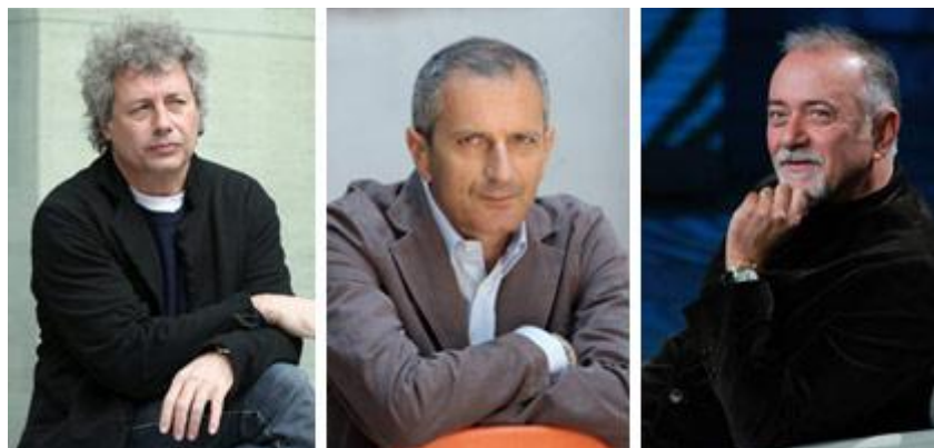
Da sinistra: Baricco, Carofiglio e Faletti