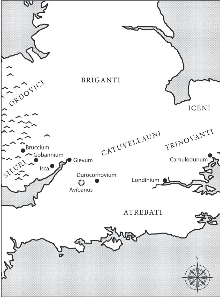
La Britannia nel 51 a.C.