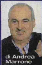
di Andrea Marrone

In libreria Nel romanzo Jerusalem di Frediani non mancano i colpi di scena