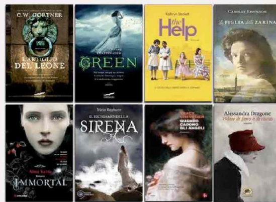
L'artiglio del leone di C.W. Gortner

Ringraziamo tantissimo le case editrici: Corbaccio, Mondadori, Longanesi, Piemme, Beat e La Tartaruga, per gli splendidi omaggi. Grazie!