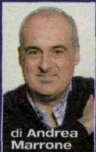
di Andrea Marrone

In libreria Filippo Ferlazzo racconta l'originale relazione tra due giovani