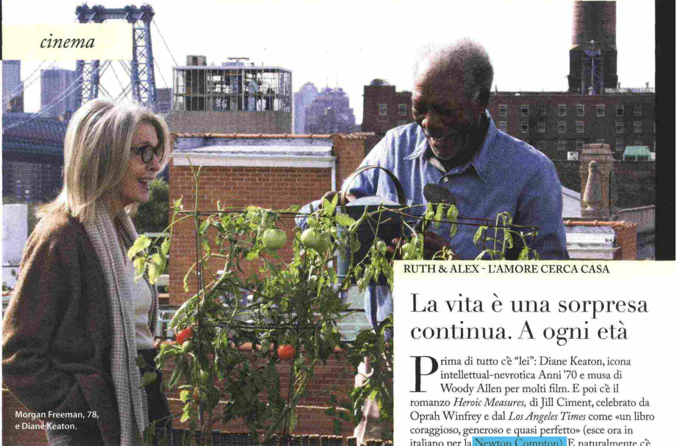
Morgan Freeman, 78, e Diane Keaton.