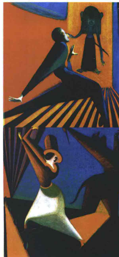
Illustrazioni © 2009 Lorenzo Mattotti

Lou Reed Mattotti, The raven - Il corvo (Einaudi, pp. 183, € 25).